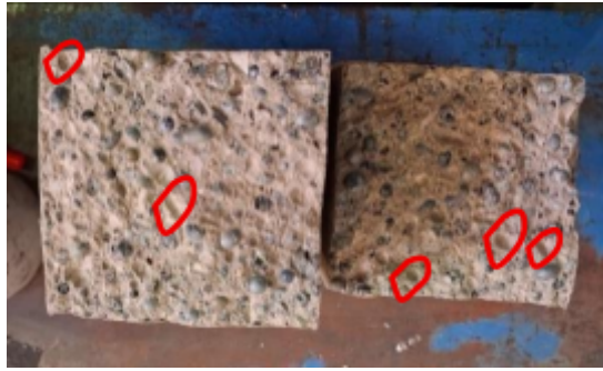
Gambar 7 Tekstur potongan penampang balok lentur sampel 3 variasi 100%.

dan tidak terlepas dari campuran beton seperti pada Gambar 7. Adapun gambaran lekatan yang kurang baik antara material slag nikel dengan campuran beton dapat dilihat pada Gambar 7.