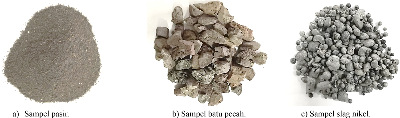
Gambar 1 Material dalam kondisi Saturated Surface Dry (SSD).

Material yang digunakan dalam penelitian ini ialah material lokal seperti batu pecah dan pasir yang berasal dari kuari Bili-bili Kabupaten Gowa sehingga karakteristik dari batu pecah maupun pasir dari kuari ini diperiksa sesuai standar yang berlaku. Demikian juga dengan material substitusi pengganti agregat kasar yang digunakan dalam penelitian ini yaitu slag nikel. Slag nikel yang digunakan berasal dari fasilitas industri pengolahan bijih nikel di Kabupaten Bantaeng. Adapun material yang digunakan dalam penelitian ini diperlihatkan oleh Gambar 1.