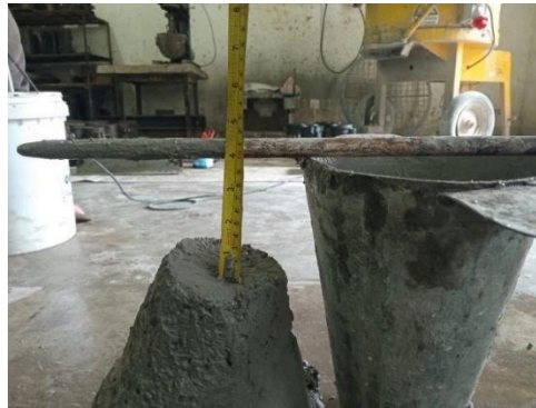
Gambar 2 Pengukuran nilai slump.

Pengujian slump beton segar dalam penelitian ini dilakukan sesuai dengan standar SNI 1972: 2008 tentang Cara Uji Slump Beton. Pengujian slump bertujuan untuk mengukur tingkat kekentalan adukan beton, yang mencerminkan kemudahan pengerjaan ( workability ) beton saat diaduk, diangkut, dituang, dan dipadatkan tanpa menimbulkan porositas maupun segregasi (pemisahan bahan penyusun beton). Slump beton didefinisikan sebagai penurunan ketinggian pada titik tengah permukaan atas beton setelah cetakan uji slump diangkat. Adapun nilai slump yang akan dicapai dalam penelitian ini ialah 10 cm seperti pada Gambar 2.