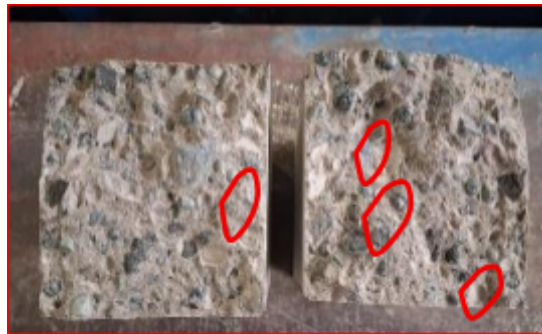
Gambar 6 Tekstur potongan penampang balok lentur sampel 2 variasi 50%.

Pada Tabel 7, juga terlihat jelas bahwa kuat lentur rata-rata pada variasi 50% mengalami penurunan terhadap variasi 0% (kontrol) sebesar 0,32 MPa (11,76%). Pengaruh ini terindikasi akibat lekatan pasta dan material slag nikel sedikit kurang baik sehingga berdampak pada kuat lentur beton, dan hal ini dapat dikonfirmasi seperti terlihat pada Gambar 6.