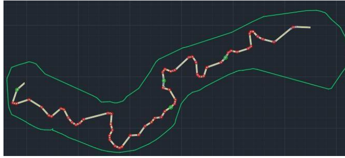
Gambar 4. Titik tikungan eksisting (hijau) memenuhi dan (merah) tidak memenuhi.